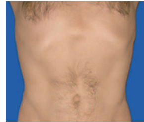
48-jähriger Mann vor Behandlung und 3 Monate später nach Absaugung der Fettpolster an Bauch und Hüfte