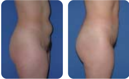
Eine 28-jährige Frau vor der Konsultation und drei Monate nach der Fettabsaugung des Bauches.