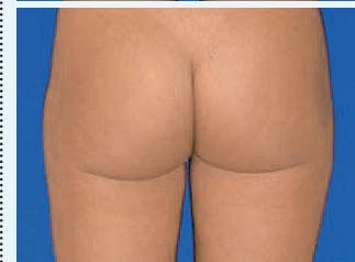
24-jährige Frau vor Behandlung und 3 Monate später nach Absaugung der Fettpolster an den Oberschenkeln aussen und innen