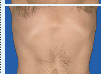
48-jähriger Mann vor Behandlung und 3 Monate später nach Absaugung der Fettpolster an Bauch und Hüfte