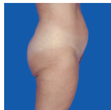
Innert 4 Wochen hat die Patientin mit der Fatburning-Methode 20 kg abgenommen.

die nötige Erfahrung und ein gutes Auge für Ästhetik an die Liposuction (Fettabsaugung). Die Folgen für Patienten, die an einen «Pfuscher» geraten, sind katastrophal. Deshalb haben wir uns ausschliesslich auf die Bereiche Cellustyling, Fatburning und Bodystyling bzw. die Liposuction konzentriert. Diese Spezialisierung auf dem Gebiet der Gewichtsreduktion und -stabilisierung hat uns kompetenter und erfahrener als andere gemacht. Unsere Methoden sind x-fach erprobt, effizient und gar nicht so kostspielig.